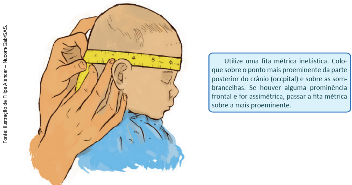
Figura 1 – Mensuração do perímetro cefálico

O exame físico de recém-nascido também deve incluir: